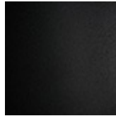
GFM73 goffrato nero