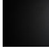
alluminio nero opaco