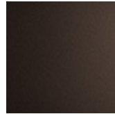
GFM18 gofrato bronzo