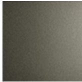
GFM11 gofrato titanio