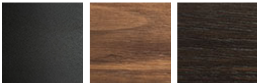
GF69 graphite gaufriert